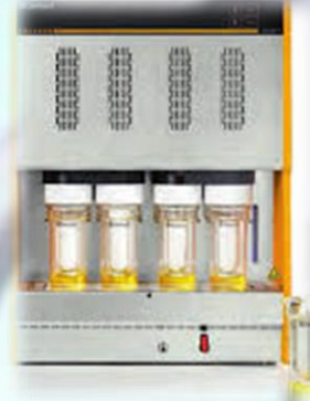
Análisis de proteína en muestras sólidas y líquidas