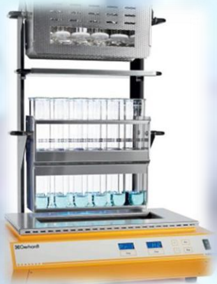
Sistemas de digestión Rápida