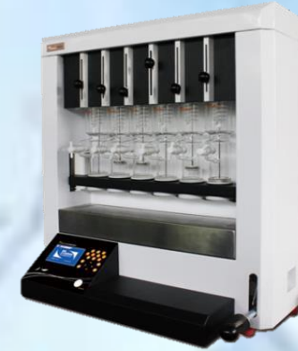
EXTRACTORES DE GRASA Y FIBRA