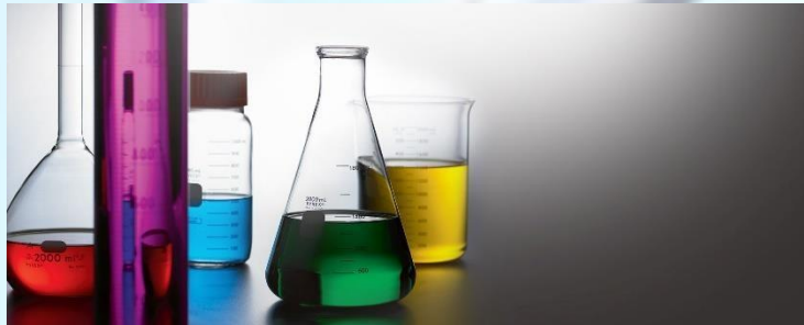
Vidrio volumétrico, vidrio general laboratorio