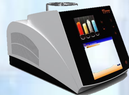
MEDIDORES DE PUNTO DE FUSIÓN