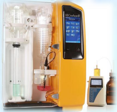
Sistemas de Destilación Kjeldahl