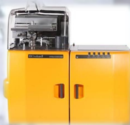
Sistemas de Extracción rápida para extracciones sólidas y líquidas